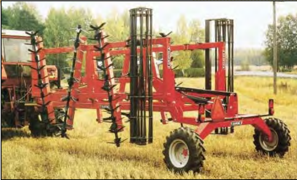
Hankmo 4600 S pakkerilla