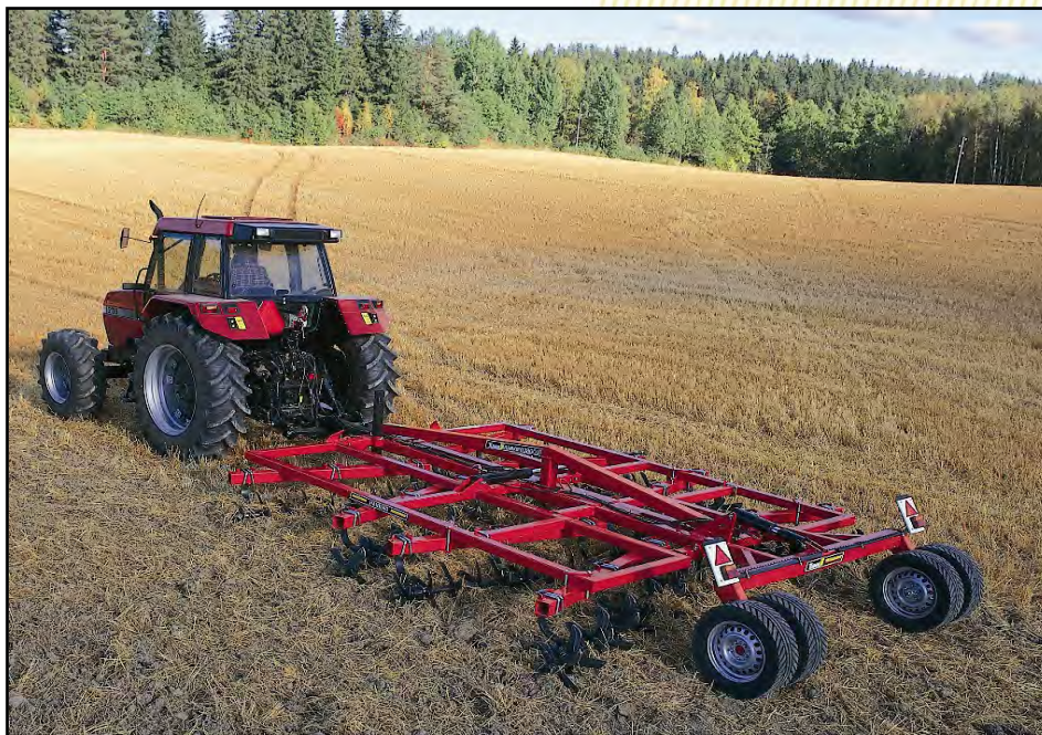
HINATTAVA HANKMO 3800 S

Tehokas syysmuokkaus kolmella tai neljällä akseliparilla täyttää kasvipeitteisyysvaatimukset. Lannan, kompostin ja maanparannusaineiden multaus käy sujuvasti Hankmolla. Saat sillä myös tasaista kylvöalustaa sänkeen, kynnökselle tai minimimuokatulle maalle. Pitkäveitsisillä Hankmoilla saat valmista jälkeä haluttuun syvyyteen kerta-ajolla. Työteho on suurimmissa malleissa jopa lähes 10 ha tunnissa!