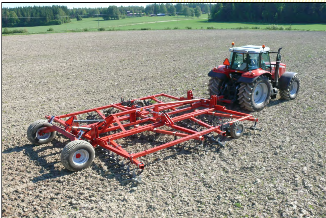
STARMIXER 6400 S